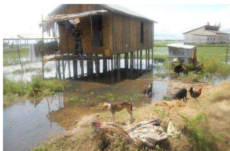
Photo 1 : Une partie du plan d'eau d'Ahomey-Lokpo Cliché : HEDIBLE, 2013

Ce plan d'eau joue d'importants rôles et fonctions dans la vie de cette communauté. Il s'agit essentiellement de la pêche qui fournissait à cette population une quantité non négligeable en matière de poissons et de ses dérivés. Mais actuellement le constat semble amer puisqu'on note une baisse considérable des produits de pêche réduisant conséquemment les revenus des habitants de cette localité. Ce plan d'eau est un facilitateur du transport maritime couramment exercé à petite échelle. L'utilité de ce plan d'eau ne se limite pas à ces deux fonctions énumérées. Il permet à la population de se rafraîchir le corps tout en se baignant. Certains habitants éprouvent du plaisir à se baigner dans cette eau dès le retour des champs. Cette même eau qui sert de bain à la population est aussi utilisée non seulement pour la vaisselle et la lessive mais aussi sert à l'eau de consommation.