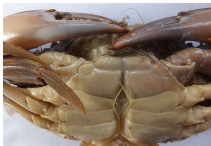
Figure 3 : Gonopodes I de Callinectes amnicola mâle