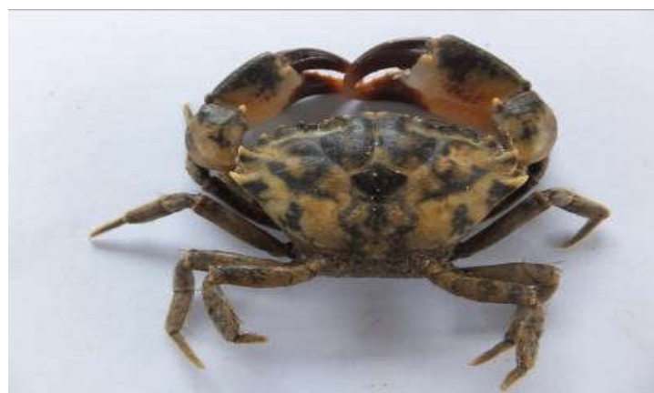
Figure 13 : Face dorsale de Panopeus africanus

La carapace est peu bombée, à régions assez bien marquées ; le front est presque droit, parfois aussi à bords incurvés ; le bord antérolatéral est pourvu de cinq dents, dont les deux premières sont arrondies à leurs extrémités et partiellement soudées ( Figure 13 ).