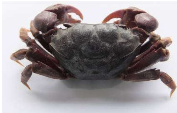
Figure 17 : Face dorsale de Metagrapsus curvatus