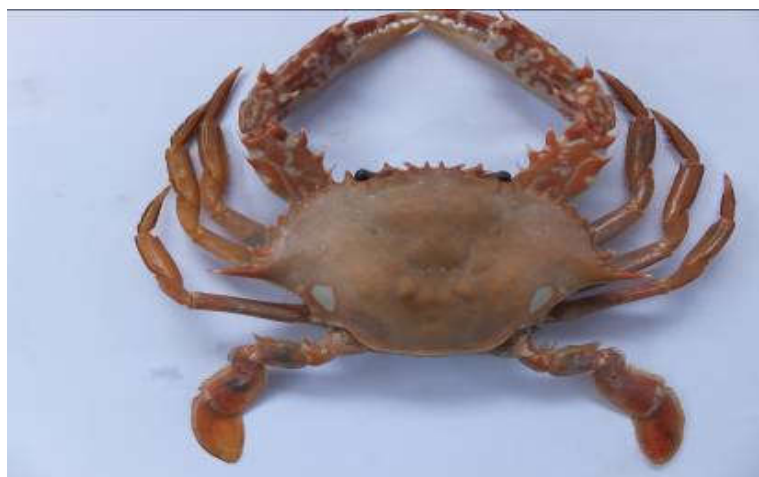
Figure 10 : Face dorsale de Sanquerus validus

Synonymes : Portunus (Posidon) validus Herklots, 1851 ; Portunus validus (Herklots, 1851)