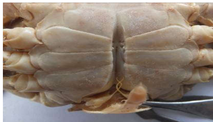
Figure 6 : Gonopodes I de Callinectes pallidus mâle