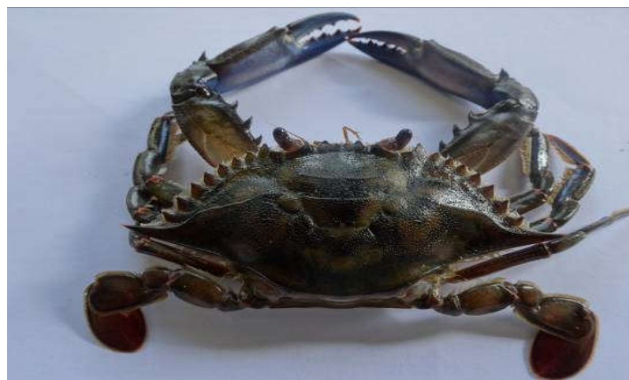
Figure 8 : Face dorsale de Callinectes marginatus

La carapace est grossièrement granulée. La ligne épibranchiale porte une inflexion distincte au milieu ( Figure 8 ). Les gonopodes I du mâle sont courts, échouant de loin et n'atteignent pas la fin du sternite du troisième périopode. La partie distale des gonopodes est quelque peu courbée à l'extérieur ; une courbe graduelle ; les gonopodes ne se touchent pas ( Figure 9 ).