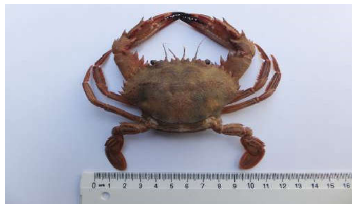
Figure 11 : Face dorsale de Cronius ruber

La carapace est légèrement convexe, recouverte d'une pubescence courte. Le front est garni de six dents très allongées ; l'angle intérieur de l'orbite est triangulaire avec une dent pointue. Le bord antérolatérale de la carapace porte neuf dents pointues de tailles très inégales alternées ( Figure 11 ). Les chélicipèdes sont légèrement inégaux, avec des crêtes granulaires et les dents; On retrouve quatre épines sur le carpe et quatre sur la surface supérieure de la paume; la surface inférieure de la paume est couverte par des rangées transversales de granules grossiers; les périopodes sont minces ; le propodus et le dactylus de la dernière paire sont plats et larges, en forme de pagaie ; le mérus est garni d'une épine ventrale.