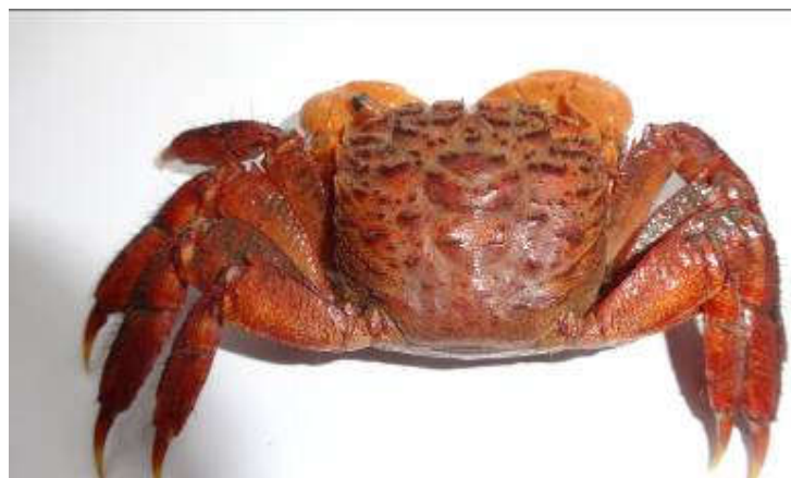
Figure 18 : Face dorsale de Guinearma huzardi

La carapace est presque carrée, rugueuse avec des lobes post-frontaux, munie de deux dents après l'orbite. Il y a la présence d'épines sur les dactyles ( Figure 18 ).