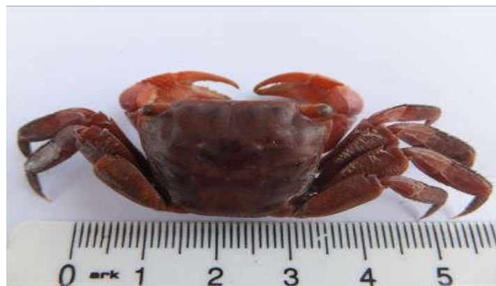
Figure 16 : Face dorsale de Chiromantes angolensis

La carapace est presque carrée ; de longues stries continues sont disposées sur presque toute la surface de la carapace sauf en arrière des orbites et sur la région cardiaque; il n'y a pas de tubercules sur le bord supérieur des pinces. Les stries continues sur la surface de la carapace permettent de reconnaître l'espèce. Le bord antérieur du mérus est denticulé ; la carpe est garnie d'une dent interne aigue ; les pinces sont lisses ( Figure 16 ).