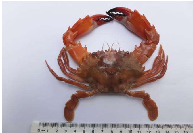
Figure 12 : Face dorsale de Charybdis hellerii