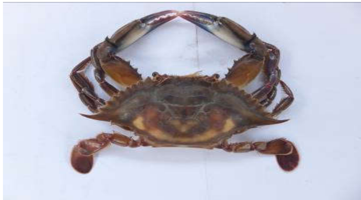
Figure 5 : Face dorsale de Callinectes pallidus

L'espèce se distingue fondamentalement des autres du genre Callinectes par une granulation fine de la carapace ( Figure 5 ). La ligne épibranchiale ne présente pas d'inflexion au milieu, très légèrement sinueux. Le premier segment abdominal se termine latéralement en un point/limite étroit recourbé. Chez le mâle, les gonopodes courts se chevauchent et se croisent ( Figure 6 ).