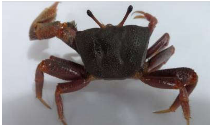
Figure 20 : Face dorsale de Afruca tangeri (mâle)