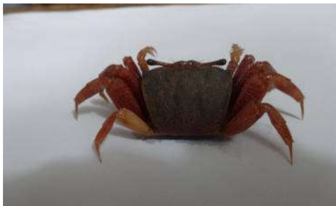
Figure 21 : Face dorsale de Afruca tangeri (femelle)