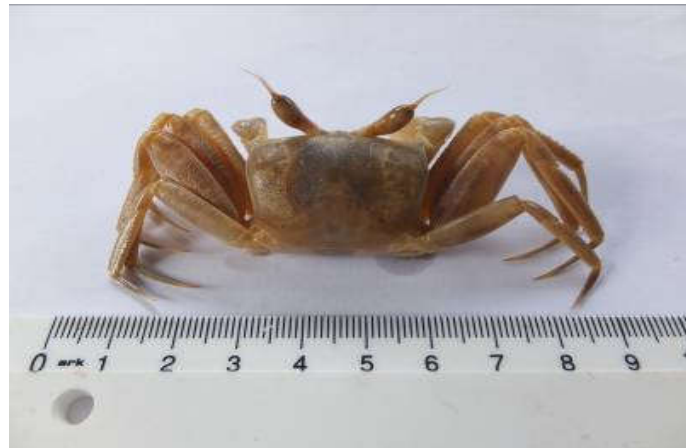
Figure 19 : Face dorsale de Ocypode Cursor

La carapace est carrée, se rétrécissant à l'arrière et légèrement granuleuse ; les pattes marcheurs ne disposent pas de brosse de poils sur le dactyle. Les pédoncules oculaires sont terminés en un mucron pourvu à son extrémité d'un pinceau de longues soies raides ( Figure 19 ).