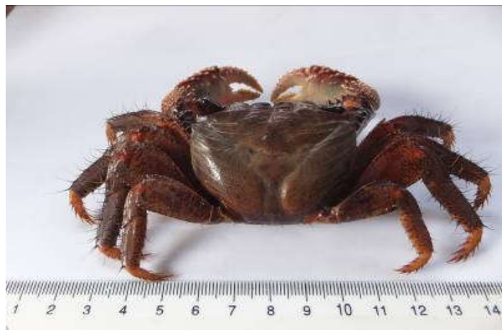
Figure 15 : Face dorsale de Goniopsis pelii

La carapace est presque carrée avec des pointes jaunes ; on retrouve des tubercules blancs sur le bord supérieur des pinces. L'espèce se reconnaît aisément par la présence de ces tubercules blancs sur le bord supérieur des pinces ( Figure 15 ).