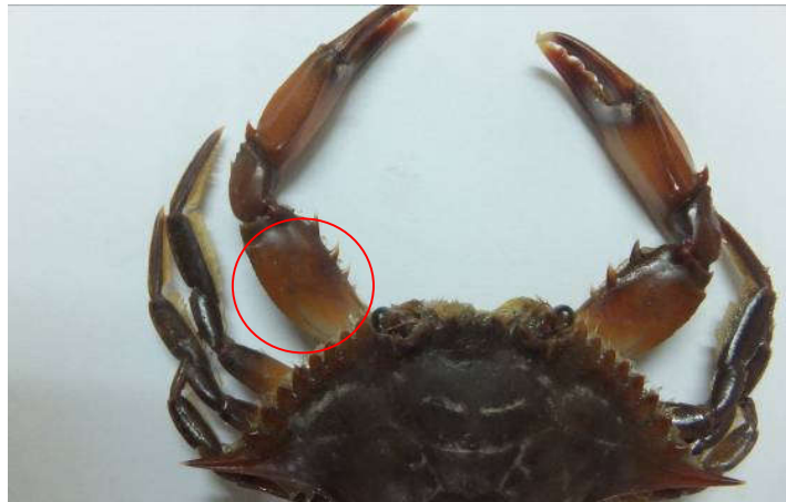
Figure 7 : Callinectes pallidus à 4 dents sur la partie antérieure du mérus gauche

Callinectes pallidus habite les secteurs lagunaires proches des embouchures. Elle est retrouvée dans les deux complexes lagunaires du Bénin. Elle n'est pas pêchée durant la saison de crue (septembre à décembre). Les tailles des individus de C. pallidus sont généralement plus petites que chez C. amnicola . Elles ont varié entre 6,5 x 17,6 mm (mâle) à 43,6 x 139,4 mm (mâle). Au titre de variations intra-spécifiques, il faut signaler également comme chez C. amnicola que certains spécimens de l'espèce portent à la partie antérieure du bras quatre dents ( Figure 7 ) contrairement à trois signalées dans la littérature [2]. La période de reproduction correspond aux mois de février à avril comme pour C. amnicola . La plus petite femelle ovigère mesure 25,0 x 62,2 mm et la plus grande 40,5 x 91,4 mm. L'espèce est commercialisée indifféremment avec C. amnicola .