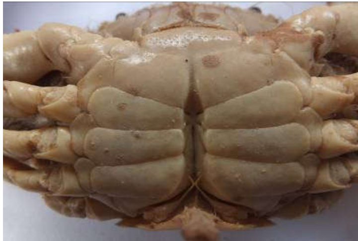
Figure 9 : Gonopodes I de Callinectes marginatus mâle