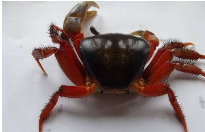
Figure 14 : Face dorsale de Cardisoma armatum