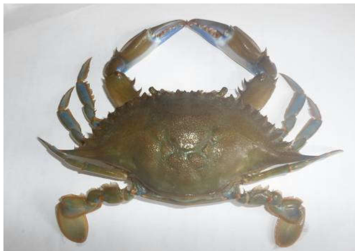
Figure 2 : Face dorsale de Callinectes amnicola