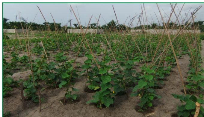
Tuteurage des plants de concombre