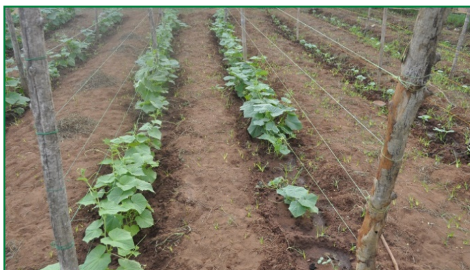
Tuteurage des plants de concombre

Protection des fruits : cette opération consiste à placer une couche de débris végétaux sous les fruits en formation afin d'éviter tout contact des fruits à la base avec le sol. Elle réduit considérablement la perte par pourriture.