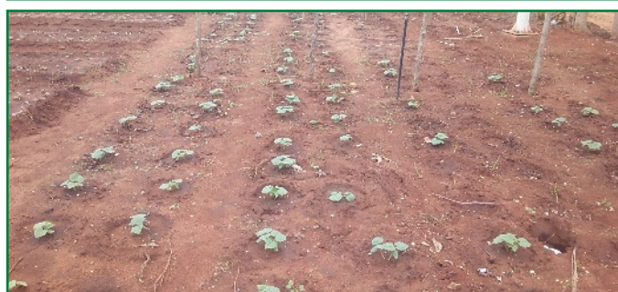
Concombre suivant l'écartement de : (100 x 50 x 50)