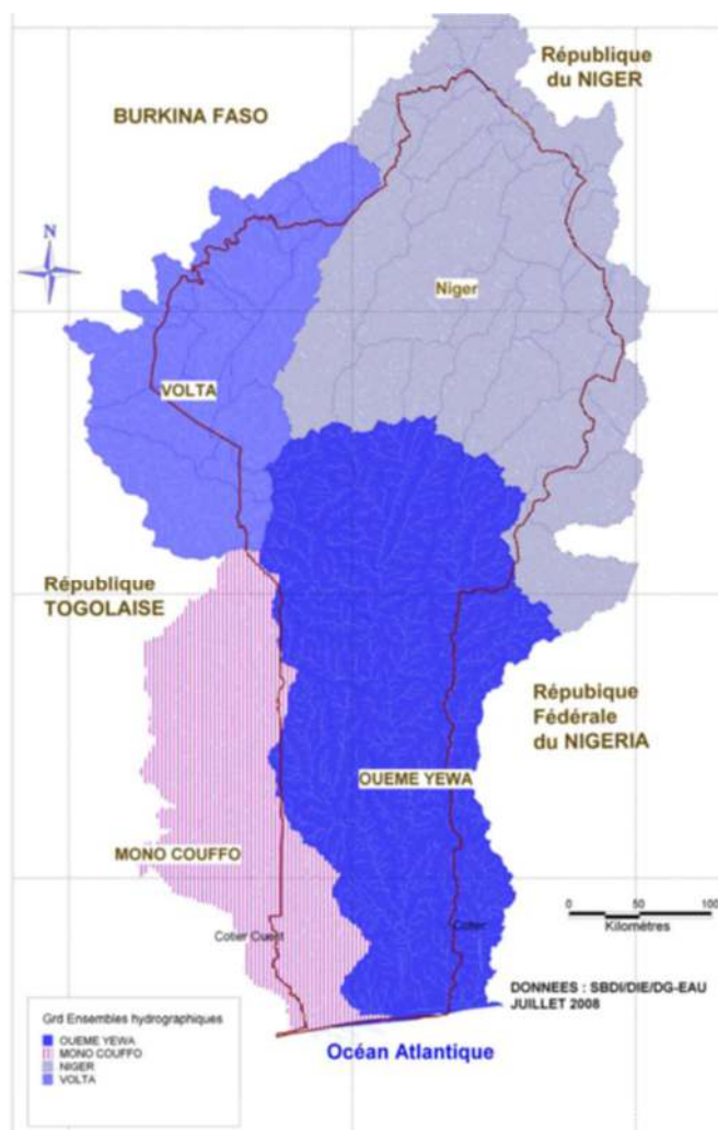
Fig. 1. Grands ensembles hydrographiques du Bénin

On distingue quatre grands réseaux hydrographiques à savoir : le bassin hydrographique du Niger, le bassin hydrographique de la volta et le bassin hydrographique côtier qui se subdivise en l'ensemble Mono-Couffo à l'ouest et en Ouémè-Yèwa à l'est. Ces différentes unités hydrographiques sont subdivisées en 86 sous-bassins sur le territoire du pays. Au total, 2000 hectares de fleuves, 1900 hectares de lacs et un système lagunaire de plus de 2800 hectares parcourent tout le pays [16]. Toutes ces masses d'eau communique avec la mer au sud du pays par les embouchures de Cotonou et de Gran-Popo au travers les deux grands lacs du pays que sont : le lac Nokoué, d'une superficie de 150Km 2 au sud du bassin Ouémè-Yèwa et le lac Ahémé d'une superficie de 85Km 2 au sud du bassin Mono-Couffo. Ceux deux lacs constituent ainsi en quelque sorte d'exutoires intermédiaires de toute pollution trainée depuis le nord du pays avant leur rejet dans la mer.