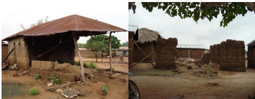
Planche 2 : Dégâts enregistrés lors d'une pluie violente à Tori- Bossito Juin 2020

L'analyse de la figure 2 montre que la Commune de Tori-Bossito présente globalement quatre saisons dont une grande saison sèche de novembre à mars, une grande saison pluvieuse de mars à juillet, une petite saison sèche dans le mois d'août et une petite saison pluvieuse de septembre à novembre. En effet, les pluies débutent en mars et font un premier arrêt en juillet. Il est à noter que les pluies sont particulièrement violentes en mai et juin occasionnant des dommages dans les champs agricoles et les habitations (planche 2).