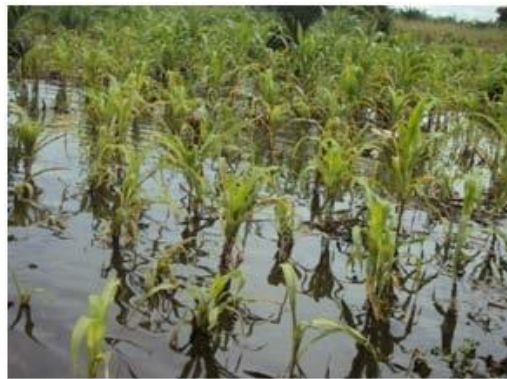
Planche 1: Un champ de maïs inondé à Tori-Bossito et conséquence d'excès d'eau sur le maïs au champ dans une exploitation à Tori-Bossito Prise de vue : Chabi, juillet 2020

L'analyse de la planche 1 montre que l'excès de l'eau dans les champs agit sur le rendement.