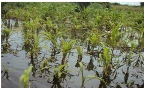
Photo 1 : Un champ de maïs inondé à Tori-Bossito juin, 2020

Les averses orageuses provoquent d'énormes dégâts tels que la destruction des cultures. La photo 1 illustre un champ de maïs inondé à Tori-Bossito.