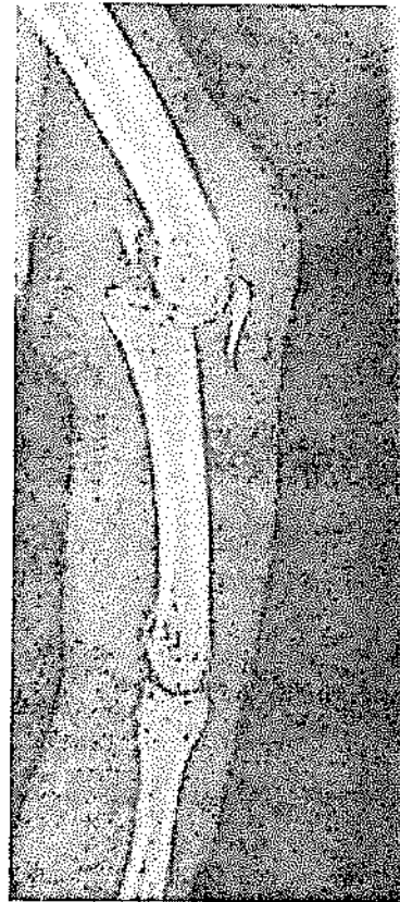
Fig. 1. Radiographie de profil du quatrième doigt. Arrachement de l'insertion osseuse de la bandelette médiane. Fracture de la base de la phalange moyenne avec incarceration du fragment ostéochondral en avant du col de la phalange proximale.

Il a bénéficié d'une réduction et fixation à ciel ouvert. L'incision était dorsale arciforme à cheval sur l'articulation. L'exploration confirmait la désinsertion osseuse de la bandelette médiane et une perte de substance ostéochondrale dorsale de la base de la phalange intermédiaire. L'abord articulaire, réalisé entre la bandelette médiane et les bandelettes collatérales, a permis de relever l'intégralité de la bandelette médiane avec son insertion osseuse et d'explorer la face palmaire de l'articulation et, ainsi, d'avoir accès au cul-de-sac palmaire proximal de la plaque palmaire, où était trouvé le fragment libre ostéochondral de la fracture articulaire. Une arthrorise première par brochage (12/10) permettait le maintien de la réduction de la luxation palmaire. L'ostéosynthèse par brochage (8/10) a été réalisée après réduction du fragment ostéochondral et réinsertion osseuse de la bandelette médiane de l'appareil extenseur (Fig. 2). La