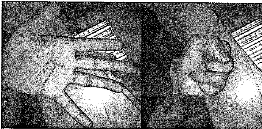
Fig. 3. Stabilité sagittale et frontale en flexion et en extension. Sagittal and frontal stability in flexion and extension.

La subluxation ou la luxation palmaire de l'IPP implique la mise en jeu de facteurs anatomiques et biomécaniques. En effet, l'effacement de la double concavité de la base de la phalange moyenne due à la fracture associée à l'arrachement de l'insertion de la bandelette médiane de l'extenseur peut conduire à une subluxation ou à une luxation palmaire, par la traction exercée par le tendon fléchisseur superficiel.