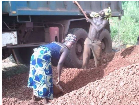
Photo 1. Exploitation de graviers dans une carrière à Dévé

Quant aux hommes pendant la saison sèche ils se préoccupent de la distillation du vin de palme en boisson locale appelée « sodabi ». Les artisans contribuent pour près de 50 % de recettes d'impôts dans la commune (SAFIC, 2004). La Commune dans son rôle de gestionnaire des ressources naturelles sur son territoire assure la gestion des carrières pour réaliser des recettes. La photo 1 montre l'exploitation du gravier sur une carrière à Dévé.