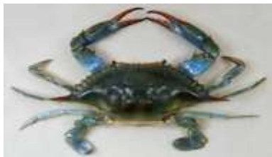
b- Callinectes amnicola