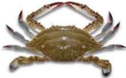
a- Portunus validus