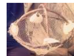
Balance à crabe